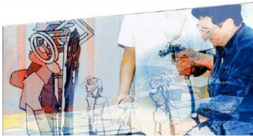
Kaléidoscope - Morez - 2009