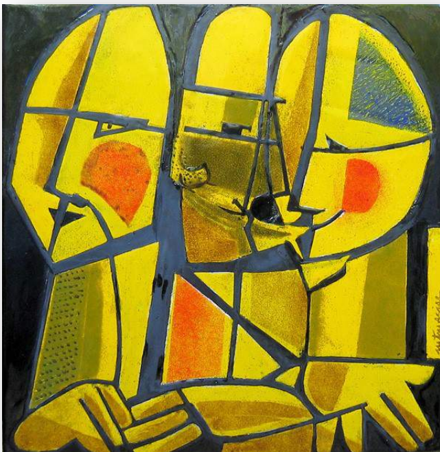
Rencontres (émail sur acier)